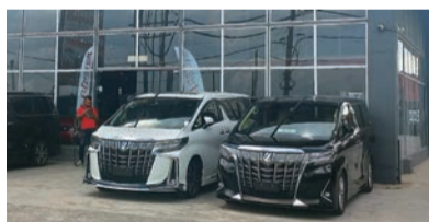
マレーシアでは日本仕様のアルファード/ヴェルファイアの人気が増えている(北部の都市、コタバリで。本誌特派員写真)