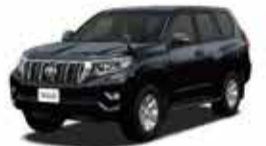
ランドクルーザープラド 5D TRJ150W TX_Lパッケージ オークション期間 (4/13~7/12)

ルボックス、マルチテレンモニター等、色々な装備が分岐点となっている。個別のAA結果等で確認いただければと思う。