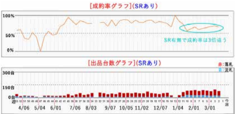
図3 ヴェルファイア AGH30W (H30 / 1~R2 / 1) SRあり 成約率及び出品台数