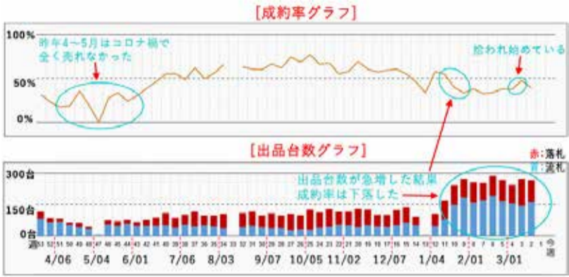
図2 ヴェルファイア AGH30W (H30 / 1~R2 / 1) 成約率及び出品台数 差し替え画像