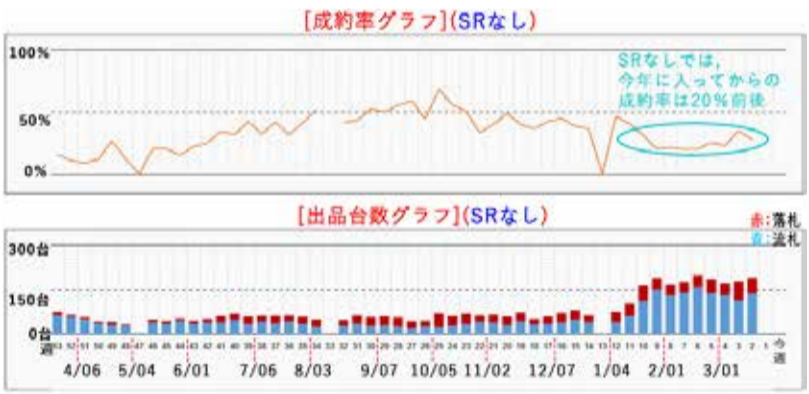
図4 ヴェルファイア AGH30W (H30 / 1~R2 / 1) SRなし 成約率及び出品台数

一番大切な事 中古車相場は『需要の強弱』と『供給の大小』により決定される。 『需要』と『供給』の流れが読めれば、未来の価格がわかる。 つまり、未来の価格がわかれば、『損切り』は撲滅できるのです。