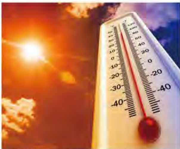
今年の夏の相場は熱波か!?

最後に皆様にお伝えしたい。繰り返しになるが、今年「熱く」厳しい夏になるだろうが、夏場のうちにうまくしつかり儲けて頂きたい。そして周囲と一緒にしやきたい気持ちはくつと抑え、夏の利益は貯め込んでおき、万一の第二波襲来に備えることをお勧めする。もちろん、第二波が来ないことを我々も切に願っているのだが。