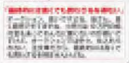
相場高騰中! 現場の声③

悪いシナリオはまだ終わらない。もしも本物、すなわち新型コロナウイルスの第二波が日本にやってきたらどうなるだろうか。