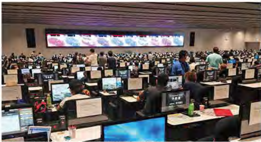
6月5日のUSS名古屋では、コロナ前の状態近くまで来場者が戻っていた

有料版では、モザイクの部分全てをお読み頂く事ができます。お申込みは 電話03 (3371) 9340まで!