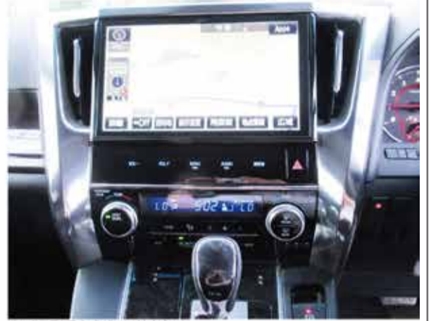
ナビは型番も入れておきたい

装備は記載したい。 輸入車は、 が価格に大きく反映する。写真だけではなかなか分からないし、ペンツなどでは、