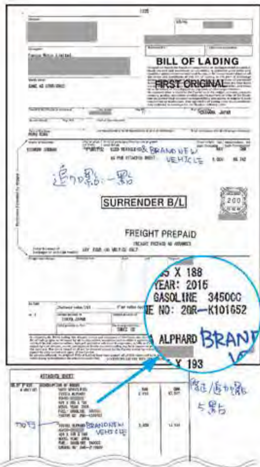
手書きで「BRAND NEW VEHICLE (新車)」と書かれたB/L (上)と、同じく手書きでエンジン型式にハイフンが加えられたB/Lの添付書類。当初からこれらを記入していたら、香港の登録はもっと早く終わっていた。