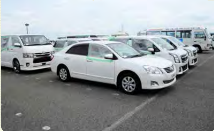
強風で小石が直撃し、窓ガラスが割れる被害が続出

先日の台風21号は、近畿地区の中古車輸出港を直撃。強風と高潮によって多数の車両が損傷し、あるいは商品価値が失われてしまった。