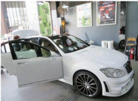
カーケアのメニューはボディ磨き、ウインドフィルム貼り、ガラスコーティングなど