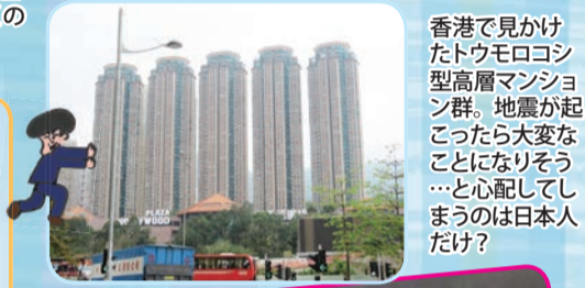
香港で見かけたトウモロコシ型高層マンション群。地震が起こったら大変なことになりそう...と心配してしまうのは日本人だけ?