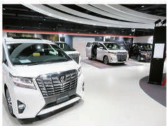
香港のトヨタ車ディーラー・ショールームに勢ぞろいしたアルファードとヴェルファイア。手前の前モデルは在庫処分、なんとHKD（約万円）引き

今回の香港取材の目的は新型アル／ヴェル輸出のヒミツ。現地でも新型が売られているのでトヨタ正規ディーラーも取材、現地仕様車についてじっくり話を聞いた。ちなみに香港にはトヨタディーラーが5店舗ある