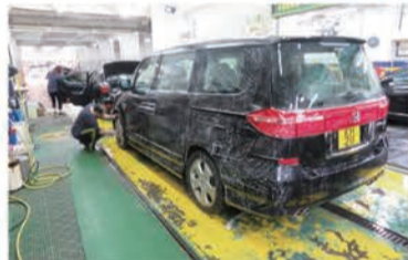
カーケアでは洗車が最も大切なビジネスになっている。1ヵ月500台をこなすという。料金は 円。"チャリンチャリンビジネス"で成り立っているのである