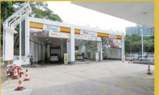
ガソリンスタンド内に設けられた