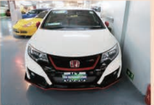
走行10,000kmの2016年シビックタイプRは49万8000HK$(約697万2000円)

有料版では、モザイクの部分全てをお読み頂く事ができます。お申込みは19面、または ☎03(3371)9340 まで!