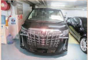
こちらの現行型アルファードには75万8000HK$(約1061万円)のプライスタグが