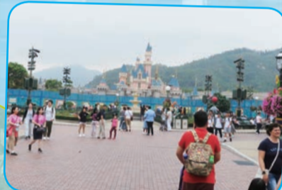
2005年、東京に続くアジア第2の拠点としてオープンした香港ディズニーランド。奥に見えるのは「シンデレラ城」ではなく「眠れる森の美女の城」。シンデレラ城に比べると、森の美女のお城はかなり小さい