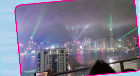
夜になると100万ドルの夜景へと変わる。今はビルとビルが連携してレーザー光で夜空を華麗に演出。ちなみに何かのイベントがあったわけではなく、これが香港の夜の日常なのだとか