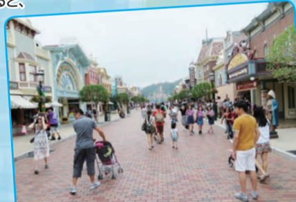
人がまばらな場内。赤字運営のうわさも。さらにキャストが不愛想なのはちょっとびっくり。トイレを聞くと、オーバーゼア、と指をさして終わり。笑顔無しだった