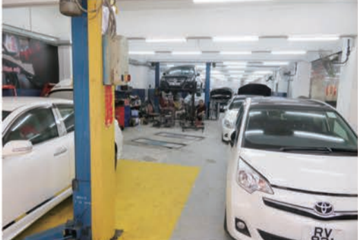
整備作業スペース。天井が特別高いわけではないのでトルタイプの車両の整備はちょっと苦しい?