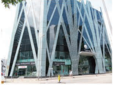
トヨタ正規ディーラー、クラウンモータースの九龍ショールーム。インテリアにも力が入っており、さながらモーターショーのような