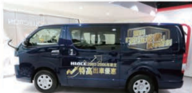
ハイエースパンの展示車には