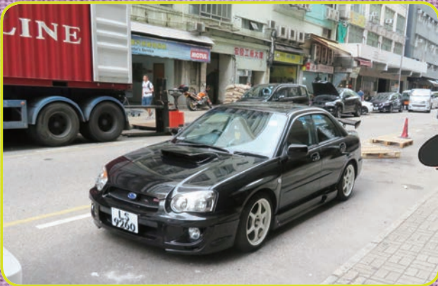
同じく街角に停まっていたGD系インプレッサ WRX セダン。エアロパーツ、社外リアウイング、落とされた車高など、チューニングの手法は日本と変わらない。

香港といえばやっぱり観光！ビジネスだけで帰ってしまったらもったいない。ここは1997年に返還されるまでイギリス領だっただけに、同じ中国でも北京や上海とは一味違う、どこかエキゾチックな雰囲気が漂う。観てよし食べてよし遊んでよし、三拍子揃っている街なのだ