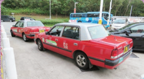
香港映画でおなじみ、クラウンコンフォートのLPG的士(タクシー)。将来はジャパントクシーに替わってゆくのだろうか?