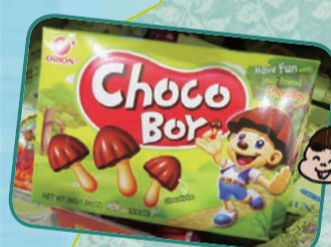
日本人ならおなじみ、有名お菓子のパクリ商品たち。イラストやネーミングのセンスは結構笑える