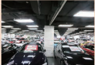
高級車400台がぎっしり並ぶ展示風景は圧巻。香港ではフェラーリもランボルギーニも右ハンドルだ