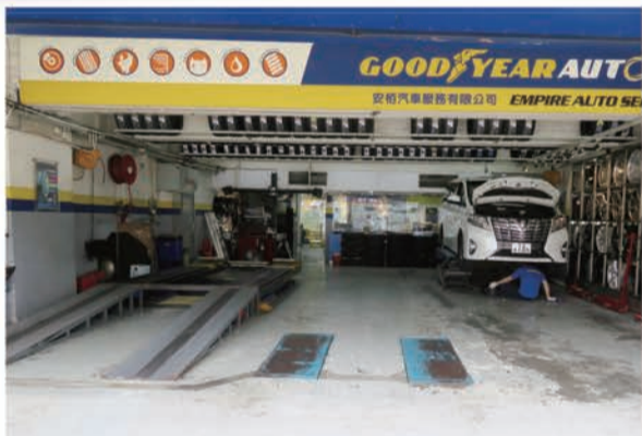
香港のタイヤショップ。ここでもインチアップは人気の模様。作業メニューにはブレーキ整備や油脂類交換、さらにはアライメント調整やサス交換も