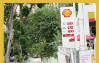
世界一高い、ともいわれる香港のガソリン料金。1%あたりの料金はなんと軽油13.5HK$(約189円)、レギュラー16.44HK$(同230円!!)