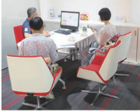
洗練された雰囲気の商談スペース

記の装備は欠かせない。 このほか装備でいえば、香港仕様は全車ツインムーンルーフを標準で装備する。日本仕様車は全車11万円（税別）のオプションだが、香港向け落札を狙うのであれば、ツインムーンルーフは必須だ。さらに、メーカーオプションのものも付け加えておく。