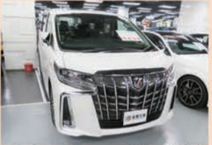
こちらのアルファードも日本から届いた並行輸入車。正規輸入車はオプションでもエアロは設定されていない