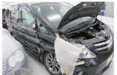
こちらは場内の钣金部門。どこの世界でも事故はあるものだ

香港ではカーケアセンターと呼ばれる業態が活況を呈している。これが香港内に500店舗ほどあるという。香港では新車ディーラーが行わないという。そもそも、新車を買うお金持ちは少ないからである。