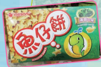
こちらはいわずもがな、おとつと、のパチモノ。