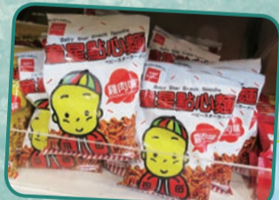
これもパクリ商品?と思ってもよく見たら正規モノだった。「童星點心麵」って、直球の名前だね