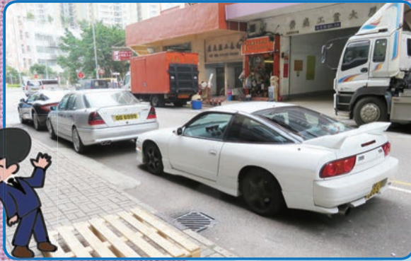
香港ではスポーツ車も人気。日本から輸入されたと思いき社外エアロをまとった180SXのダッシュボードには3連追加メーターが。奥はW202系のAMG C36