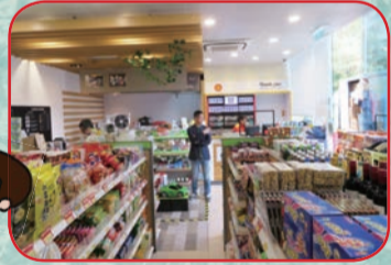
ガソリンスタンドに併設されたコンビニ店はこの感じ。日本の有名お菓子の正規モノ、パチモノが並んでいた