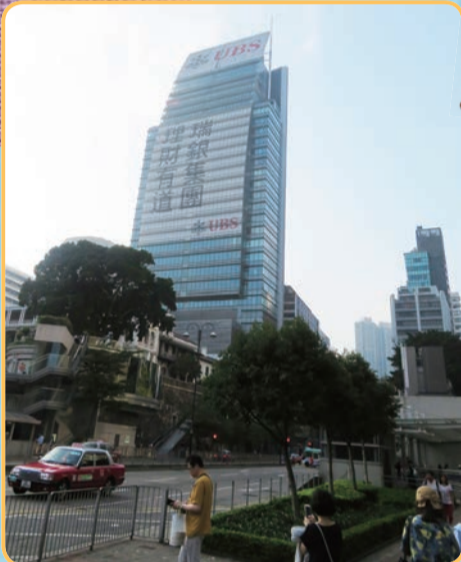
香港・金融街にそびえ立つスイスの金融機関、UBSのビル。ガラス面全体に文字を入れる、斬新な広告手法は香港式?