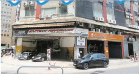
カーケアセンターのひとつ