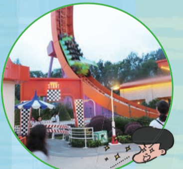
人気アトラクションのひとつ「RCレーサー」も夕方になるとこの通り。並ぶ人はいなくなりました!