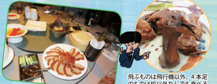
飛ぶものは飛行機以外、4本足のものは机以外なんでも食べるという中華民族。だから料理の皿に鶏の頭が載っていたくらいで驚いてはいけません。ちなみにこの頭は飾りです