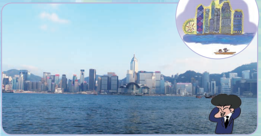
九龍の有名な観光スポットから香港島を眺める。映画などでおなじみの風景だ