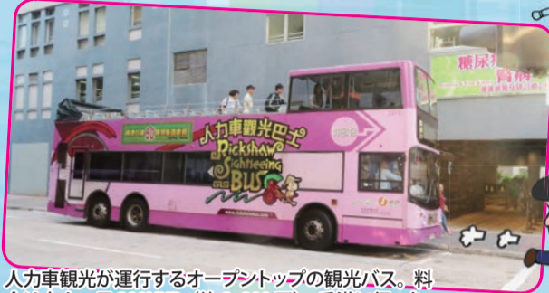
人力車観光が運行するオープントップの観光バス。料金は大人一日200HKD(約2,800円)。香港に行ったら是非乗ってみよう