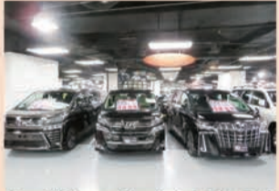
やっぱりここだったか! 日本の中古車AAでプレミア付で取り引きされている30後期アル・ヴェルが雁首を揃えていた