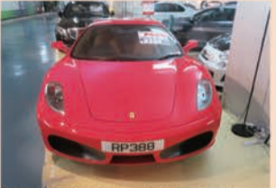
2008年式F430。走行7,200km、整備記録簿付でお値段93万8000HK$(約1313万円)