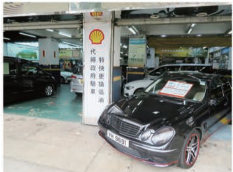
空きスペースでは中古車販売も行う。手前の2004年式E500は売りもので HK$(約 万円)のプライスボードが