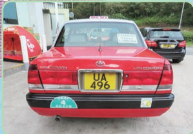
『4座席』のステッカーが貼られた的士のリアビュー。乗車定員が4人ではなく、お客さんが4人乗れますよ、という意味だ。