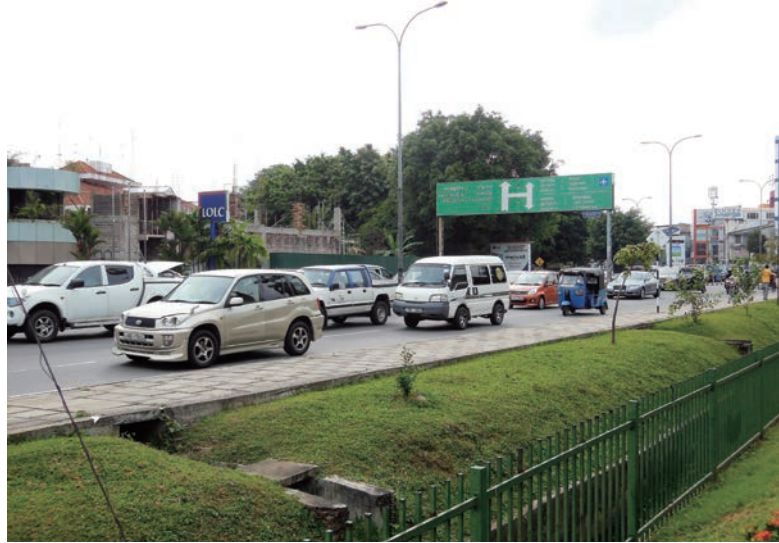
コロンボ市内交通渋滞の様子

的難しい。しかし過去には、組合や団体が成果を挙げた事例もある。記憶に新しいのは、12年3月、不意打ち的にスリランカ政府が打ち出した物品税等関税の引き上げで、これは予告なく発表と同時に施行されたため、海上輸送途上の車両も対象となり、業界を震撼させた。この時、速やかに現地へ赴き、直接当時のラージャバクサ大統領に直談判し、一部見直しに成功したのが日本中古車輸出業協同組合(JUMVEA、佐藤博理事