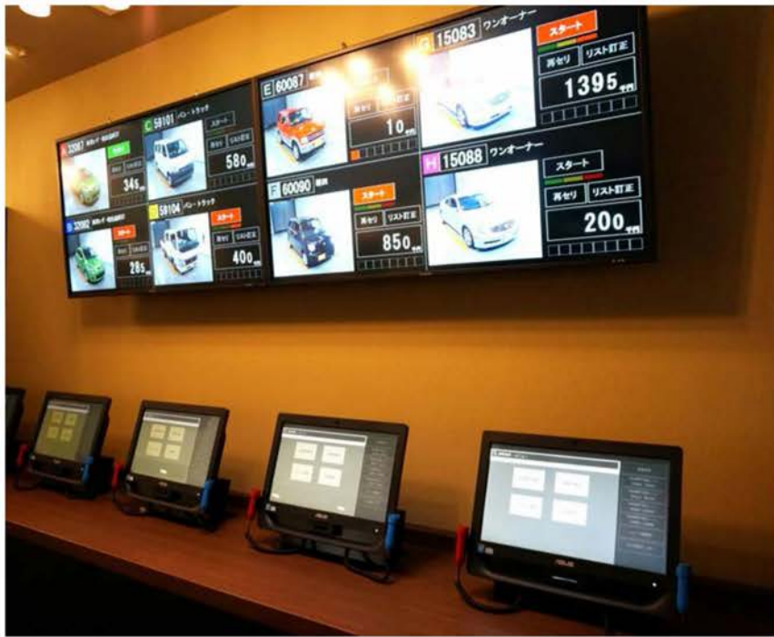
ポスの仕組みは複雑だ