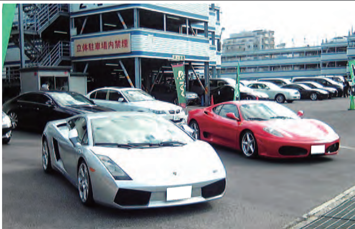
「抜き自慢」ではフェラーリなどのスーパーカーも多かった(写真はイメージ)

《1面から続く》 取で仕入れ、オークションで売却した。500万円も儲けられた理由は「安く買えたから」(回答者)とある。なぜ、タマ数の少ない最終型の車体をこの金額で仕入れられたのか、ぜひ知りたいところだ。