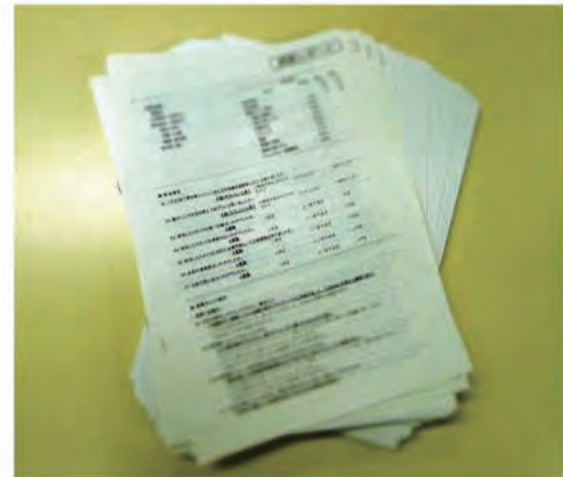
覆面調査の結果で自社の弱点を改善

選ばれないのは それなりの理由が 話を元に戻すが、この ように、お客さんから選 ばれなかったお店には、